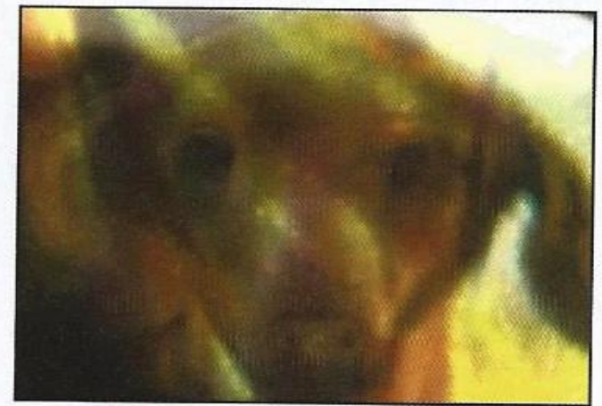
Ci-dessus: l'animal vivant est à gauche et la « trans-image » à droite.